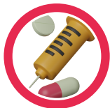
Vía de administración