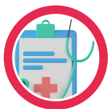
Información dada al paciente