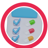
Registro de la toma-administración